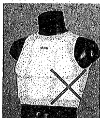
《着用不可の胸ガード》